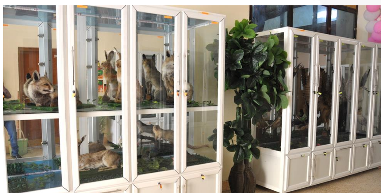
متحف للحيوانات المحنطة يحتوي حيوانات البيئة العراقية