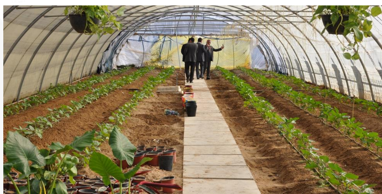
بيت بلاستيكي ملحق بالقسم للأغراض البحثية